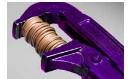
Wir bringen Budget und Erfolg zusammen

Dafür sind wir da – mit Zufriedenheitsfaktor!