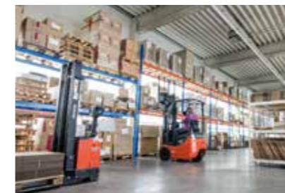
Perfektes Fulfillment: Logistik-Lager in Leichlingen

Dafür sind wir da – mit Zufriedenheitsfaktor!