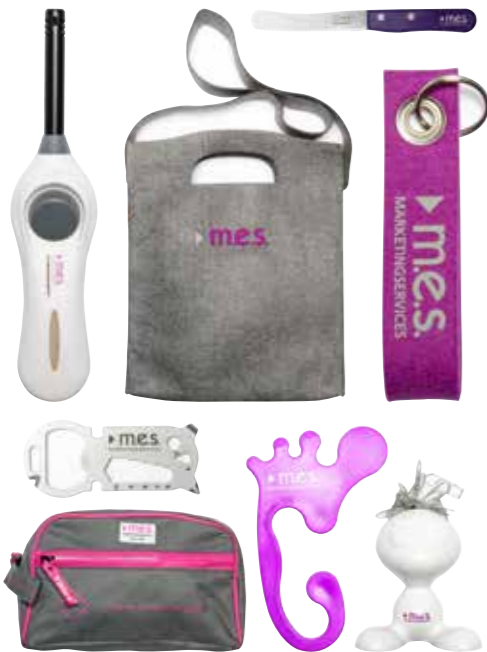
Hohe Werbeerinnerung mit Werbeartikeln